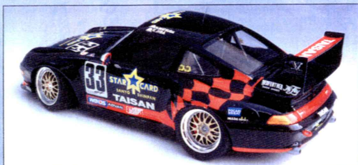
Da unterhalb der Haube nur ein Kühler vorhanden ist, sollte man diese fest verkleben.

klappe separat modelliert, dem Modellbauer ist jedoch zu empfehlen, diese fest zu verkleben. Auch die Lackierung stellt keine Ansprüche: schlicht schwarz. Bei der Bemalung der Bodenplatte ist unbedingt darauf zu achten, daß die Seitenkanten seidenmattschwarz werden – sie bilden später den Übergang zur Karosserie. Eine wirkliche Herausforderung sind die Abziehbilder. Sehr viel Sorgfalt erfordern die roten Flächen, dabei sollte man zunächst die Flagge oder Streifen aufbringen. Rote Decals sind auch für die Spiegel und Lufteinlässe vor-